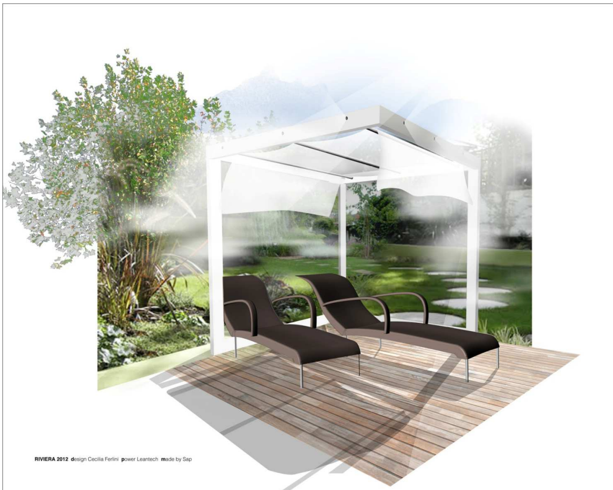
RIVIERA 2012 design Cecilia Ferlini power Leantech made by Sap