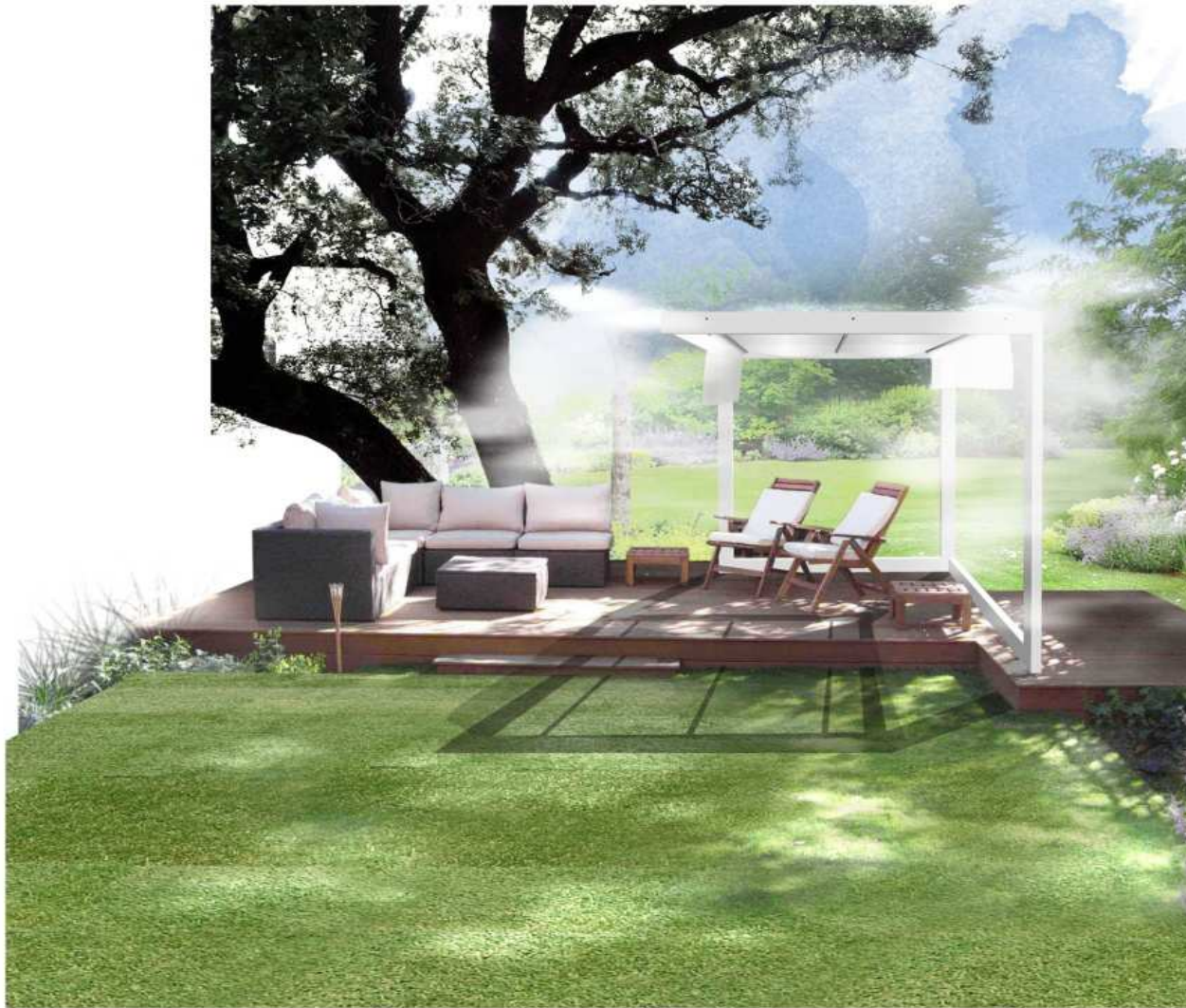
RIVIERA 2012 design Cecilia Ferlini power Leantech made by Sap